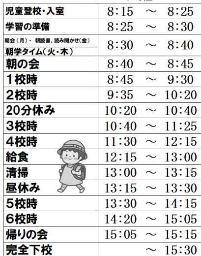
亀高小学校 通常時程