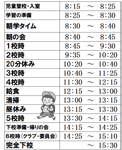
亀高小学校 クラブ・委員会時程